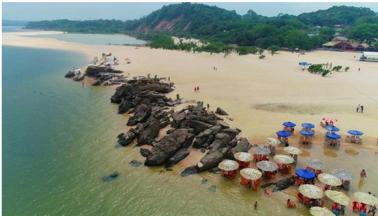
(Praia de Ponta de Pedras)

Há muito se clama pela valorização do turismo sustentável que possa desenvolver as peculiaridades que tornam as belezas naturais de Santarém tão atrativas e rentáveis aos olhos do viajante nacional e estrangeiro, que busca recantos exóticos para o lazer sazonal, sem deixar, por óbvio, de valorizar o habitante local, que utiliza o espaço nativo como atividade econômica e moradia.