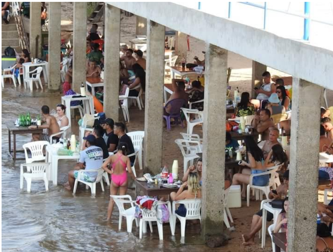
(Praia do Maracanã, setembro/2021)

Num passado não muito distante, levada pelo deletério projeto destrutivo das praias santarenas, a gestão do mesmo grupo político da atual gestão decretou a morte da Praia da Vera Paz, ao levar a ferro e fogo o projeto de construção do porto graneleiro da Cargill. No mesmo animus , “concretou” a praia do Maracanã e agora, leva adiante o malfadado senso paisagístico para Ponta de Pedras, ao custo de mais de dois milhões de reais.